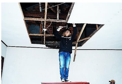
Gambar 11. Perbaikan Plafon diruang Kelas oleh Mahasiswa