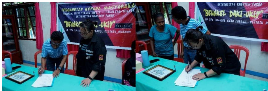
Gambar 9. Penandatanganan Berita Acara Kegiatan PkM UKiP (UKiP dan Pihak Mitra SD. YPK Imanuel Batu Lobang)