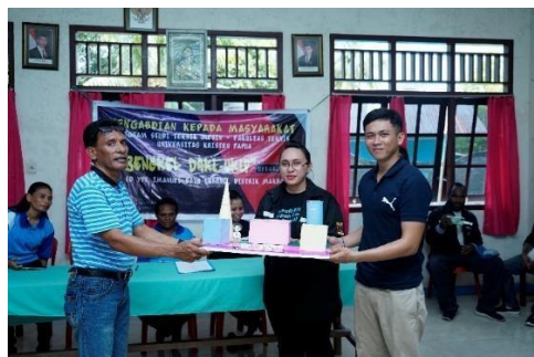
Gambar 10. Penyerahan bantuan modul ajar untuk Guru dan perangkat lainnya