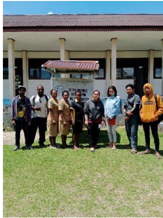
Gambar 5. Foto bersama Tim PkM bersama Guru SD. YPK Imanuel Batu Lobang dalam observasi lapangan