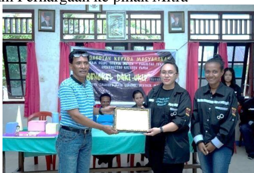
Gambar 16. Penyerahan Piagam Penghargaan dari Pihak UKiP ke Pihak Mitra