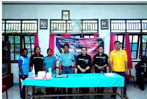
Gambar 8. Foto bersama dengan Pihak Sekolah dan Kepala Kampung Batu Lobang