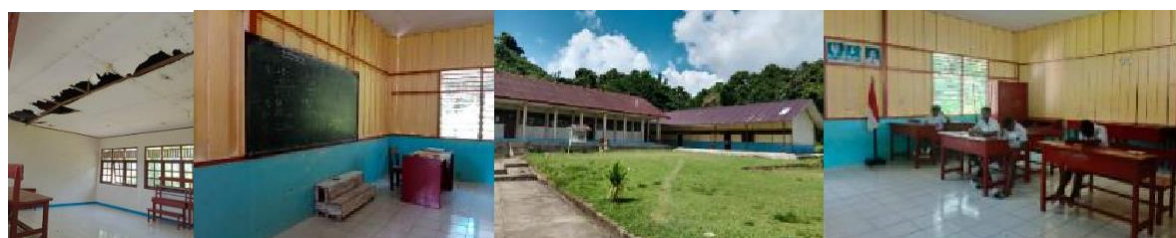
Gambar 1. Dokumentasi Survei Lokasi PkM

Adapun susunan acara pada kegiatan PkM dapat dilihat pada tabel di bawah ini :