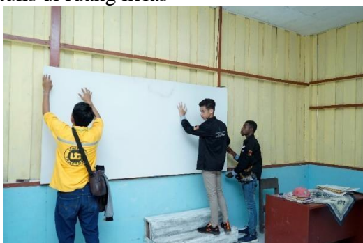
Gambar 12. Perbaikan Papan Tulis Kelas

e. Pembuatan design gambar Tut Wuri Handayani di area sekolah