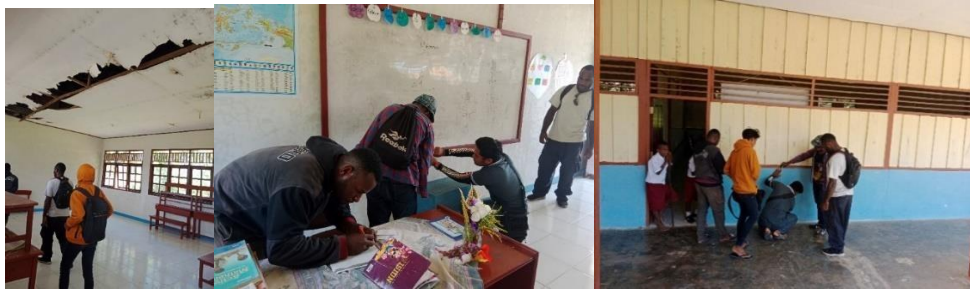
Gambar 4. Observasi lapangan oleh Tim PkM di SD. YPK Imanuel Batu Lobang