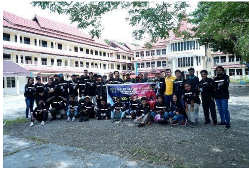
Gambar 7. Persiapan Tim PkM (Dosen dan Mahasiswa)