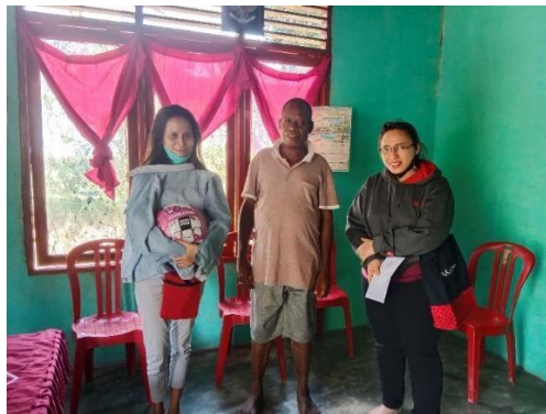
Gambar 2. Tim PkM melakukan wawancara langsung dengan Pihak Pengurus Kampung