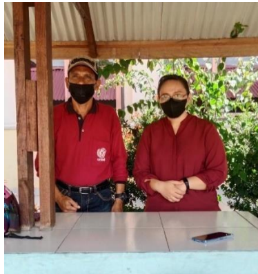
Gambar 6. Kordinasi dengan Kepala Sekolah SD. YPK Imanuel Batu Lobang