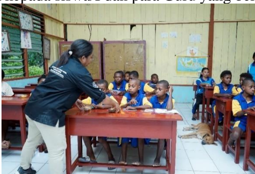
Gambar 17. Ramah tama dengan guru dan siswa SD YPK Imanuel