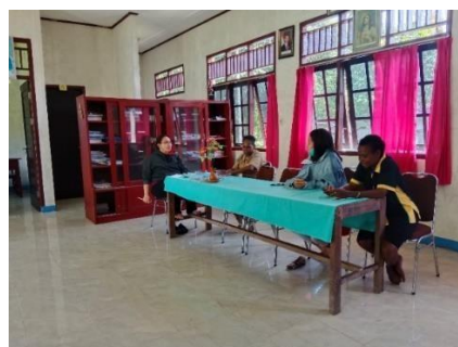
Gambar 3. Wawancara Tim PkM dengan Pihak Guru di SD. YPK Imanuel Batu Lobang